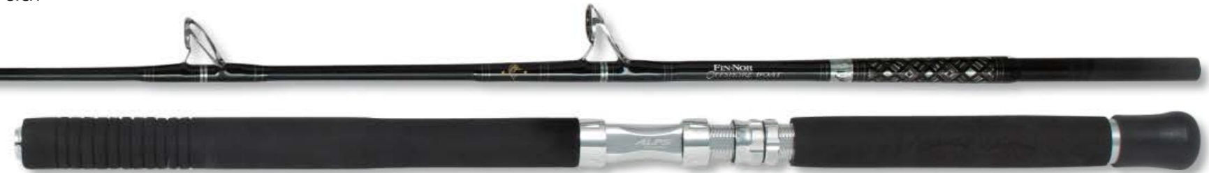
RAINER KORN BOAT