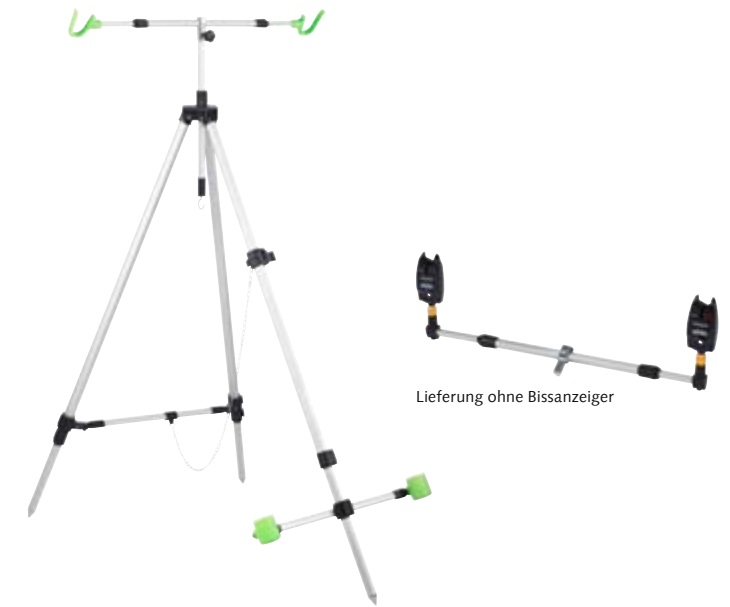
Lieferung ohne Bissanzeiger

Dank des seitlichen Fluchtschutzes gibt es für die Köderfische kein Entrinnen. mehr. Die extra kleine Maschenweite von 3mm ermöglicht auch das Senken auf kleine Köderfische.