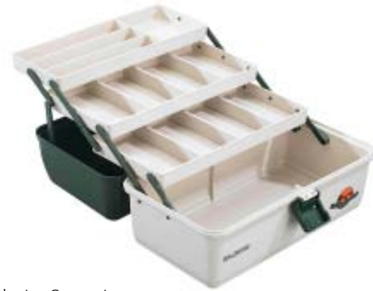
Gerätekasten Compact 3-ladig, Maße 36 x 20 x 20cm