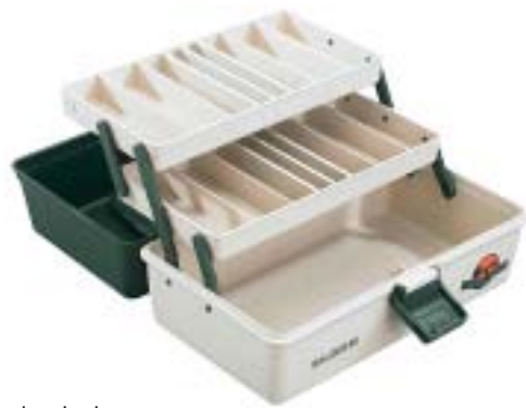
Gerätekasten Junior 2-ladig, Maße 30 x 18 x 15cm